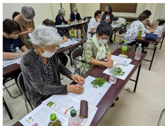
カタバミの葉で10円玉を磨いたらピカピカに ✨