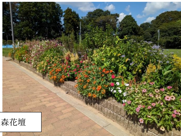
こちらは少年の森花壇

しかし!!バラ花壇で問題が発生しました。元気がないバラの株元を掘るとなんと大量のコガネムシの幼虫が… 急遽 28日に臨時で駆除作業を行いました。花たちを守らなければ…!